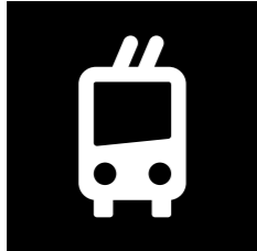
SCHÉMA TROLEJBUSOVÉ DOPRAVY MĚSTO OSTRAVA